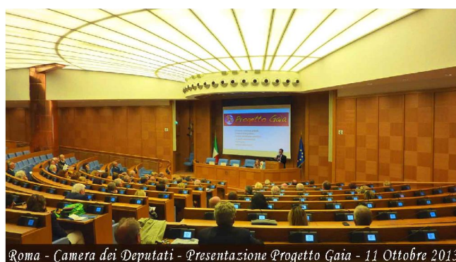
Roma - Camera dei Deputati - Presentazione Progetto Gaia - 11 Ottobre 2013

Il “Progetto Gaia-Kirone” è un avanzato programma di educazione alla consapevolezza globale e alla salute psicofisica ideato e sviluppato da un'equipe di docenti, professori universitari, educatori, psicologi e medici dell'associazione di promozione sociale “Villaggio Globale” di Bagni di Lucca, che è stato approvato e finanziato dal Ministero del Lavoro e delle Politiche Sociali , ai sensi dell’art. 12, legge 7 dicembre 2000, n.383, anno finanziario 2015, e che è sostenuto dalla Federazione Italiana Centri e Club UNESCO , l’agenzia delle Nazioni Unite per l’Educazione, la Scienza e la Cultura.